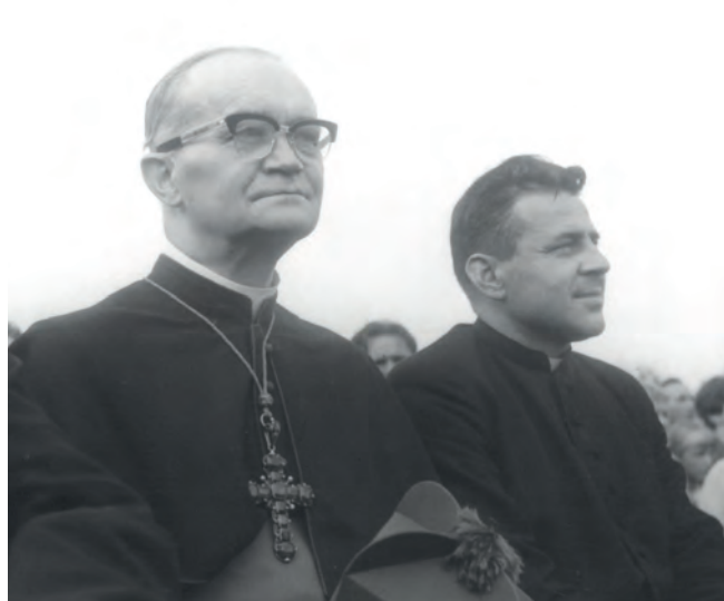
Biskup Josef Hlouch se svým sekretářem a budoucím kardinálem Miloslavem Vlkem (foto je z období mezi červnem 1968 a srpnem 1971)

i staří, všichni v úctě k naší rodině, která nikdy nikomu neublížila a která i z velké chudoby všem rozdávala dary velké, a hudba hrála na dvoře, potom na návsi a mladí si i zatančili. Co to písní... A druhý den přišli hned ráno: dekret do Spálova... Hledali jsme, kde to je... A byla pestrá ta dráha kněžská, Kladky, Jesenec, Zátor, Hodolany, fakulta – až biskupství v Budějovicích, po onom nesmrtelně krásném dni 15. srpna 1947."