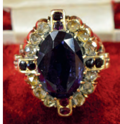
Další biskupské prsteny, které jsou uloženy v depozitáři Českobudějovické diecéze

říše římské si totiž dělali nárok předávat berlu a prsten novým arcibiskupům, biskupům a opatům u lenního slibu církevních hodnostářů. To ale uráželo papeže a oslabovalo moc nejvyššího úřadu v církvi. Po podpisu Wormského konkordátu z 23. září 1122 císař předával na znamení světské moci žezlo. Berla i prsten se pak staly symboly duchovní vlády.