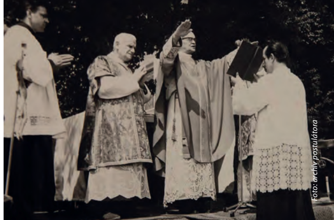
„Všem žehnám, všechny Vás v srdci na věčnost nesu.“