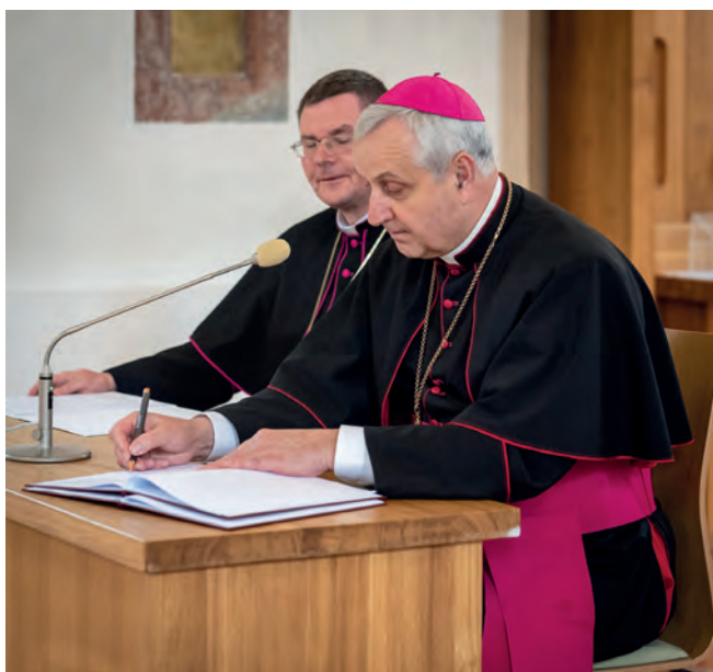
Diecézní biskup v katedrále slavnostně podepisuje dokument „Syntéza diecézní fáze synodálního procesu“ (23. 4. 2022)

Vzhledem k velmi krátkému termínu, do něž měla být diecézní fáze synody uzavřena, to bylo poněkud znepokojující. Nicméně jsme začali studovat všechny existující podklady a těšili se na setkání s celostátním koordinačním týmem. Tento tým zajišťoval spojení s centrem – vatikánským Sekretariátem synody. Když pak k očekávanému setkání formou videokonference došlo, zjistili jsme, že ani v Římě ještě neexistuje nějaké přesné zadání a vzor dalšího postupu. Vše se začalo podobat skautské bojové hře, kde teprve po dosažení jednoho cíle objevíte pokyny k hledání dalšího. Tak jsme se pustili do neznáma s důvěrou, že nás Bůh povede a prosili o pomoc Mudrce od Východu, aby i nám posvítla hvězda při našem putování.