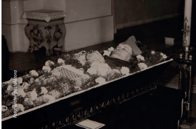
Rakev s ostatky zesnulého biskupa byla vystavena v katedrále sv. Mikuláše 16. 6. 1972 již od 7 hodin ráno. Velké zástupy věřících prošly katedrálou, aby naposledy spatřily tvář svého pastýře.