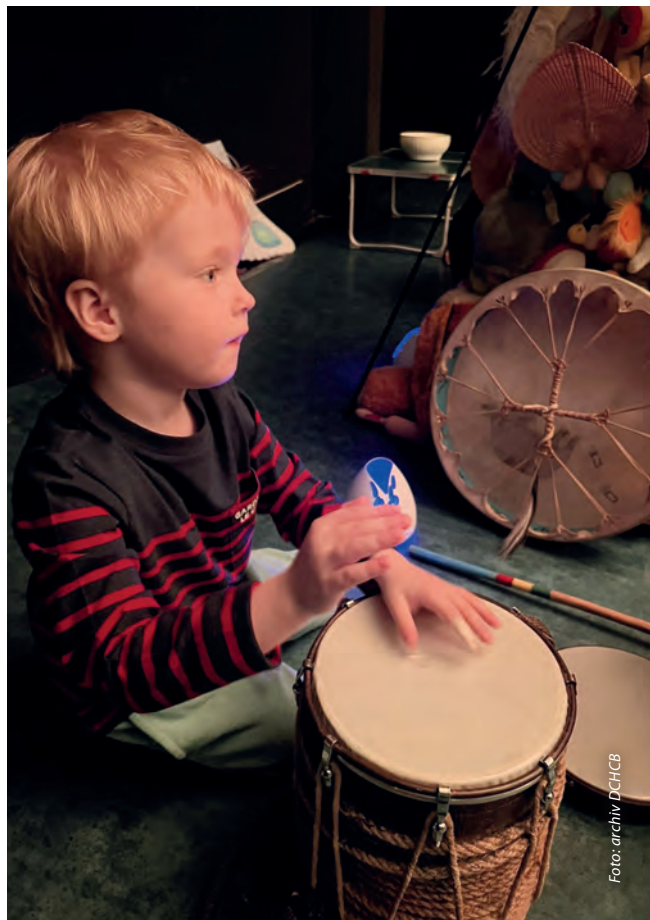
Děti si také vyzkoušely hru na hudební nástroje.