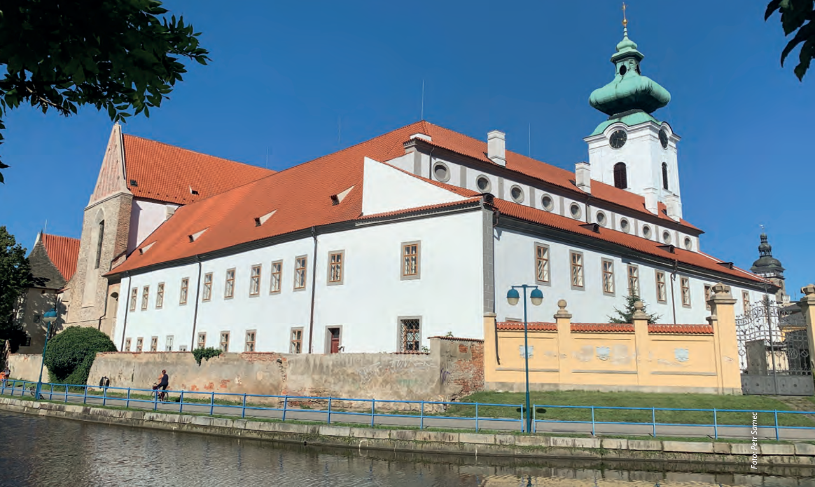
Areál bývalého Dominikánského kláštera v Českých Budějovicích se stává oblíbeným turistickým cílem. Více informací o programu na letošní sezónu najdete v článku na straně 22.