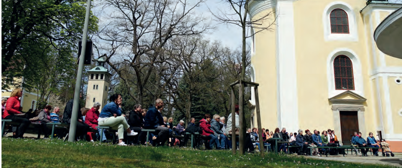
Na letošní pouť přijeli poutníci z celé republiky

právě v den pouti. Otec biskup Zdeněk připomenul, že letos je to 1 500 let, kdy tento světec nechal zabít(!) vlastního syna Sigerika, když hněv proti němu vzbudila jeho druhá žena a Sigerikova macecha křivým obviněním.