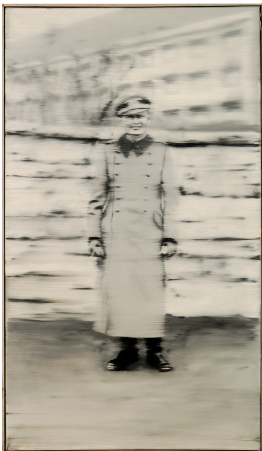
Gerhard Richter: Onkel Rudi/Strýc Rudi, 1965. Olej na plátně, Památník Lidice.